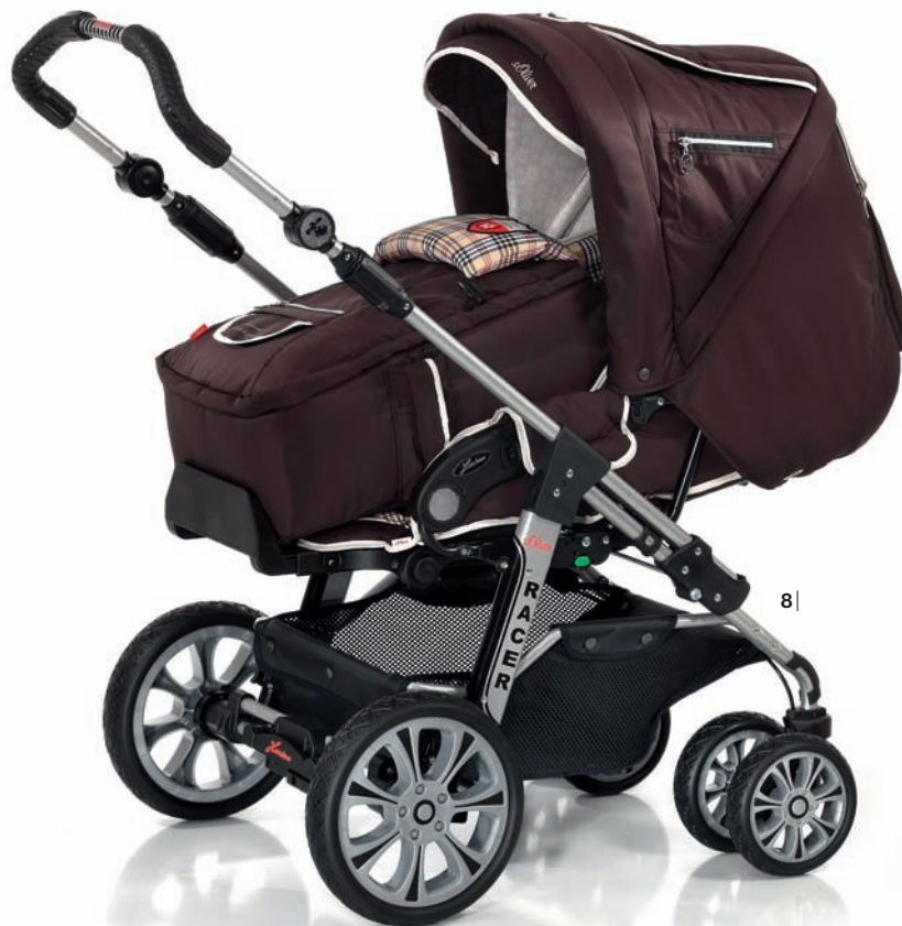
6| Gestell zusammengeklappt 7| inkl. Doppelschwenkräder 8| Racer S mit Softtasche