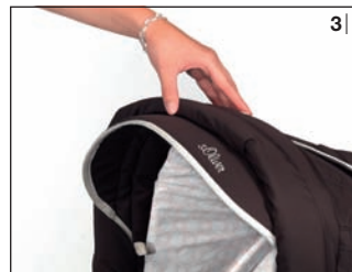
1 | mit Autositzadapter 2 | inkl. Wendeeinlage 3 | geräuschlose Verdeckverstellung 4 | Sky mit Kombitasche