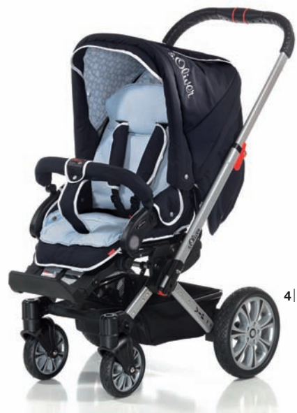
1| zusammengeklappt 2| Wanne zusammengeklappt 3| VIP XL mit Wendebettwäsche 4| VIP XL mit Sportwagenaufsatz