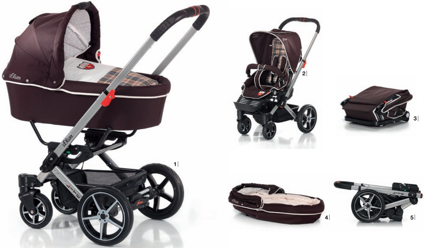
1| Lite XL mit Wendebettwäsche 2| inkl. Sportwagenaufsatz 3| Sportwagenaufsatz zusammengeklappt 4| Wanne zusammengeklappt 5| Gestell zusammengeklappt